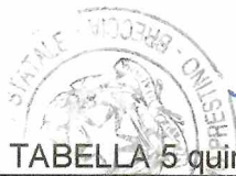
TABELLA 5 quinquies